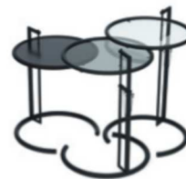
Schwarz, Metall schwarz, Parsolglas, Kristallglas Black, black metal, smoked glass, crystal glass