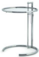
Chrom, Kristallglas Chrome, crystal glass

Estructura regulable en altura de tubo de acero cromado o con recubrimiento en polvo negro. Tablero de cristal claro, gris parsol o de metal lacado en negro. Para más detalles y colores, ver lista de precios.