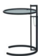
Schwarz, Parsolglas Black, smoked glass