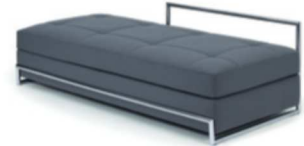
DAY BED 1925