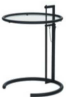
Schwarz, Kristallglas Black, crystal glass