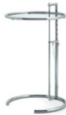
Chrom, Kristallglas Chrome, crystal glass