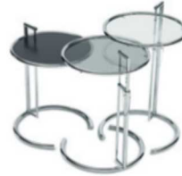
Chrom, Metall schwarz, Parsolglas, Kristallglas Chrome, black metal, smoked glass, crystal glass